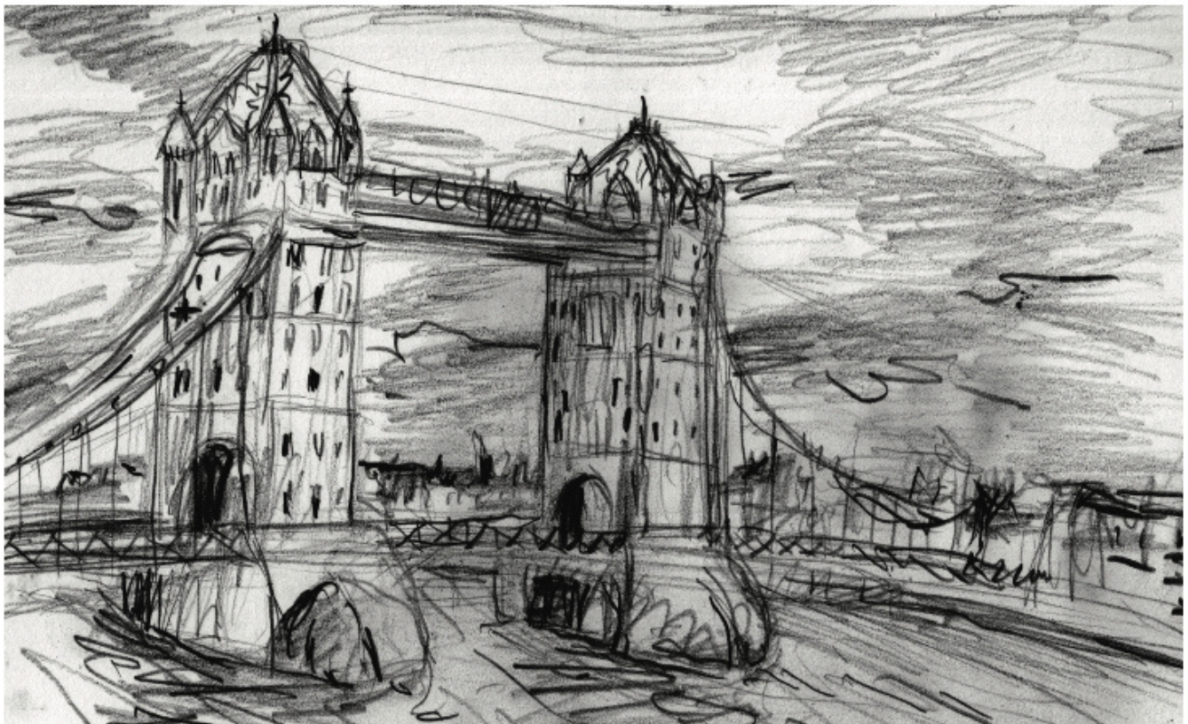
Tower Bridge, London